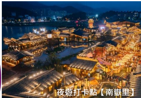
夜遊打卡點【南嶽里】

衡山風景名勝區位於湖南省衡陽市，主要景點有南嶽衡山和南嶽大廟等。這裡一年四季都樹木茂盛，滿目蒼翠，到處都透著一份靜意。