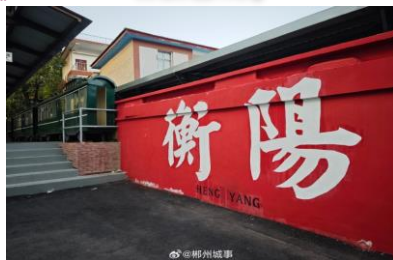
『保衛裡文化創意街區』

『南嶽衡山』：衡山風景區被列入第一批國家級重點風景名勝區名單；衡山，古稱“南嶽”，中國五嶽名山之一。南嶽旅遊風景名勝區居湘中偏東地區，以主峰祝融為中心。