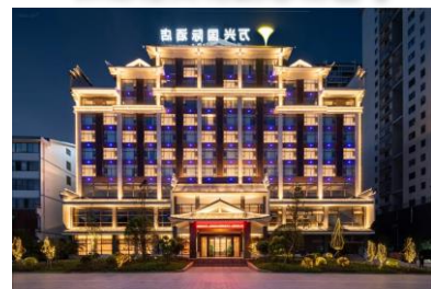
南嶽衡山景區店『萬興國際酒店』

於指定時間前往衡陽東站，乘高鐵(直車或中轉車)返香港西九龍站。旅程到此完滿結束。