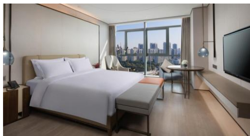
衡陽『蒸湘華美達酒店』